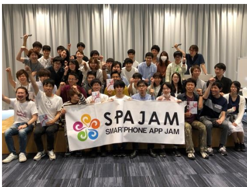
関西予選集合写真