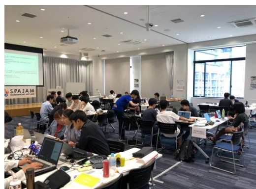
関西予選開発風景