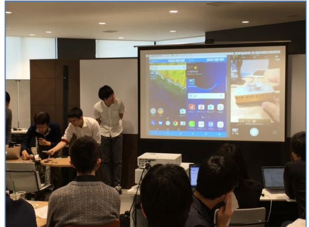
大阪予選プレゼン風景

締切日が 2017 年 4 月 24 日（月）と迫った札幌会場をはじめ、仙台、東京 A、東京 B、東京 C、東京 D、名古屋、福岡の各予選の参加チームは現在募集中です。