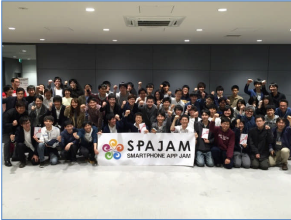
大阪予選集合写真