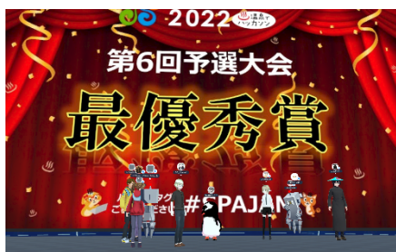
VR空間等のITツール等を活用

新型コロナウイルス感染防止の観点からリアルハッカソンを開催することが困難な状況となっておりますが、このような危機的な状況をポジティブに捉えて、ビデオ会議やチャットツール等のITツールを活用したオンラインハッカソンのフォーマットを開発しました。