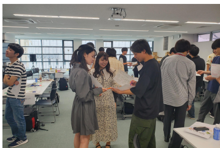
アイデアソン風景