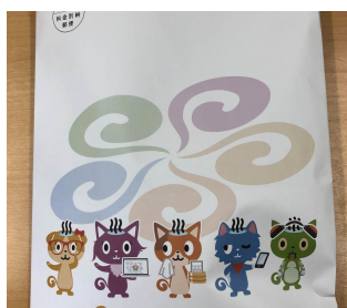
参加者全員に「お楽しみ袋」を配布