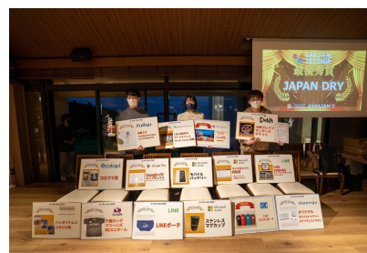
本選では豪華賞品を提供