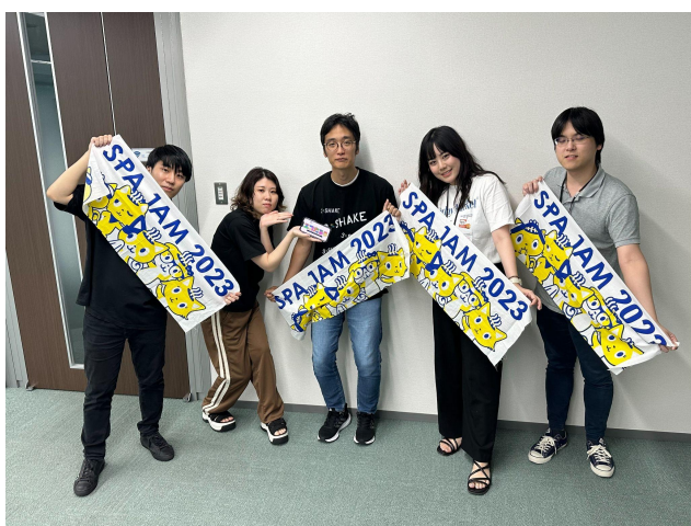
最優秀賞チーム「しじみ神」