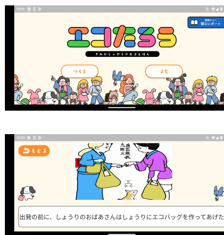
開発アプリ「エコたろう」