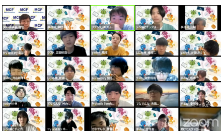
アイデアソン風景

Protopia Sendai Lab.(My Bottle) ラスト(SORTING) yado4(起きろサカモト) 半day(プラスト) シン・猫とチップス(スナック 栄子) try and try(電士独戦 エコキテル) でなでんな(ECOJOURNEY) しじみ神(エコたろう) 助けて!スヴァローグ!!(CLEANER) from 北海道(Eve)