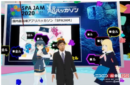
VR 空間等の IT ツール等を活用

新型コロナウイルス感染防止の観点からリアルハッカソンを開催することが困難な状況となっておりますが、このような危機的な状況をポジティブに捉えて、ビデオ会議やチャットツール等の IT ツールを活用したバーチャルハッカソンを開催します。