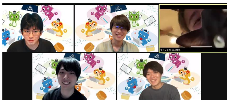
最優秀賞チーム「サトリラボ」