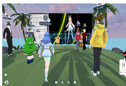
VR空間でのラジオ体操