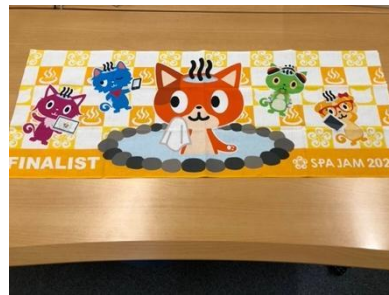
参加者全員に「お楽しみ袋」を配布