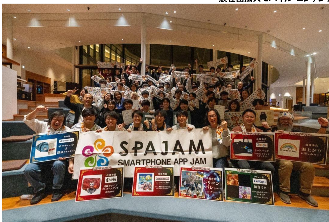
2025 出場者の集合写真

2026 年 4 月 17 日 SPA JAM2026 実行委員会 一般社団法人モバイル・コンテンツ・フォーラム