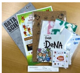
参加者全員に「お楽しみ袋」を配布

【2025年訪問実績】Google、Apple、Niantic、OpenAI、LinkedIn、Computer History Museum、Internet Archive、デジタルガレージ(DG717)、...etc.