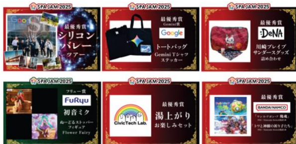
本選では豪華賞品を提供