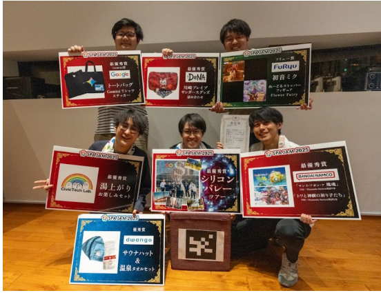
最優秀賞チーム「谷川近衛騎士」