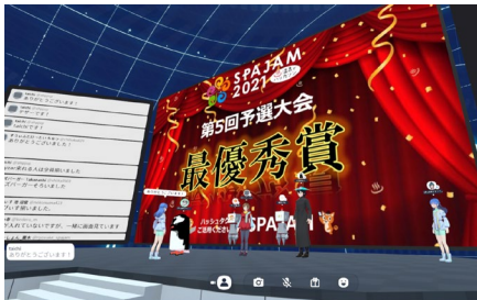
VR 空間等の IT ツール等を活用

新型コロナウイルス感染防止の観点からリアルハッカソンを開催することが困難な状況となっておりますが、このような危機的な状況をポジティブに捉えて、ビデオ会議やチャットツール等の IT ツールを活用したオンラインハッカソンのフォーマットを開発しました。