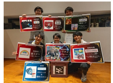
本選では豪華賞品を提供