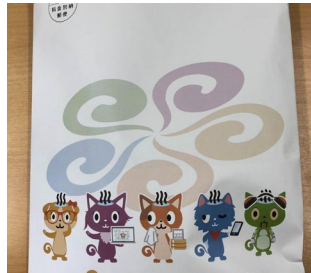
参加者全員に「お楽しみ袋」を配布