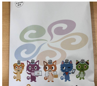
参加者全員に「お楽しみ袋」を配布