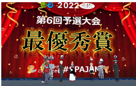
VR空間等のITツール等を活用

新型コロナウイルス感染防止の観点からリアルハッカソンを開催することが困難な状況となっておりましたが、このような危機的な状況をポジティブに捉えて、ビデオ会議やチャットツール等のITツールを活用したオンラインハッカソンのフォーマットを開発しました。