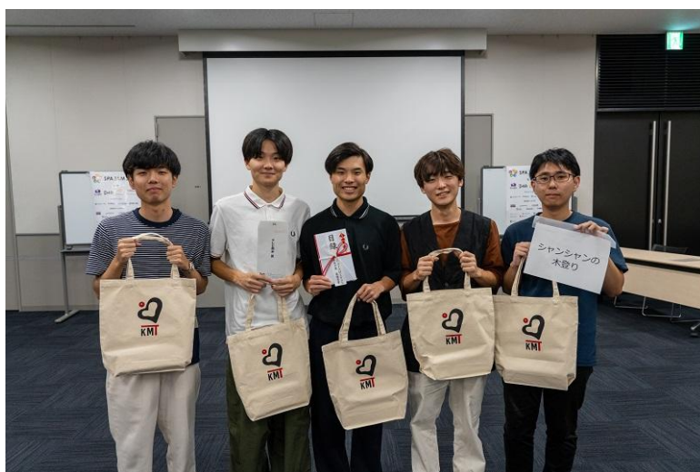
最優秀賞チーム「シャンシャンの木登り」