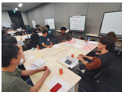
アイデアソン風景