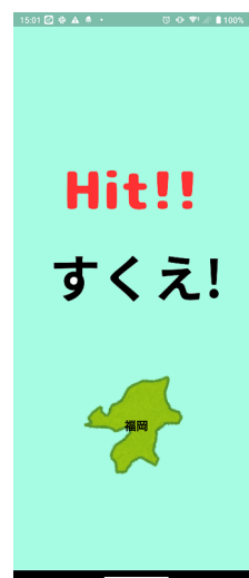
開発アプリ「地方すくいず」