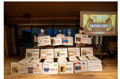
本選では豪華賞品を提供