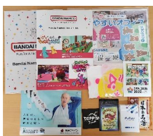
参加者全員に「お楽しみ袋」を配布