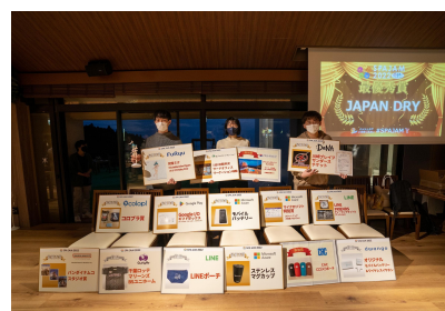
本選では豪華賞品を提供