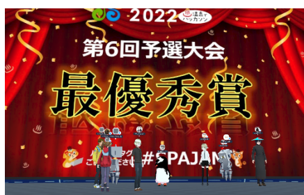
VR空間等のITツール等を活用

新型コロナウイルス感染防止の観点からリアルハッカソンを開催することが困難な状況となりましたが、このような危機的な状況をポジティブに捉えて、ビデオ会議やチャットツール等のITツールを活用したオンラインハッカソンのフォーマットを開発しました。