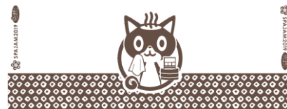
参加者全員に「お楽しみ袋」を配布