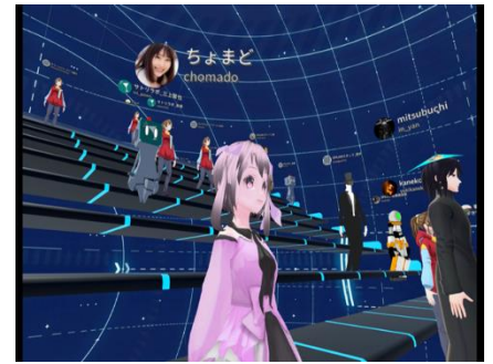
VR 空間でのプレゼン