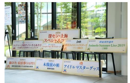
本選では豪華賞品を提供

SPAJAM では、実力試し、モノづくりのワクワク、ハッカソンの刺激、新しい仲間との出会い、温泉… 得られるものは無限大。クリエイターとしての実力を存分に発揮してみませんか？