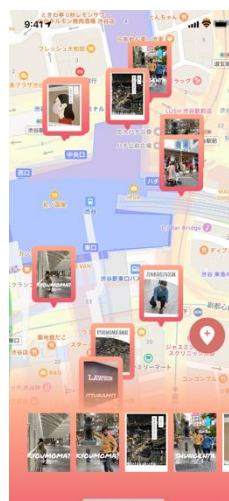
開発アプリ「ほすすめ」