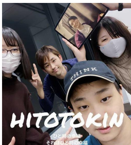
最優秀賞チーム「おひっこし」