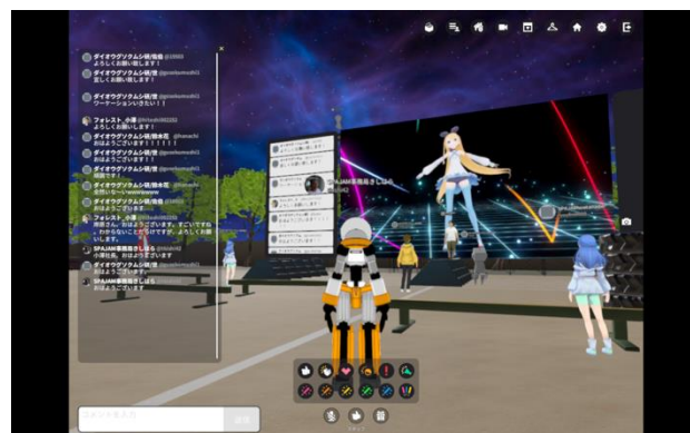
ラジオ体操の風景