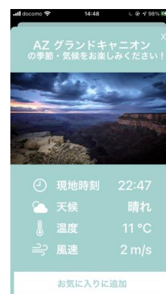
開発アプリ「Season と時の部屋」