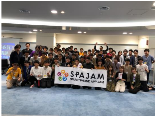
仙台予選集合写真