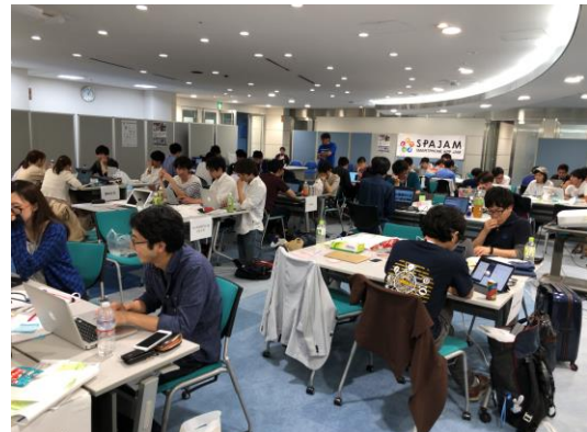
仙台予選開発風景