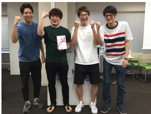
最優秀賞チーム「パーカーズ」