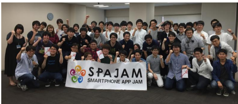
東京 B 予選集合写真