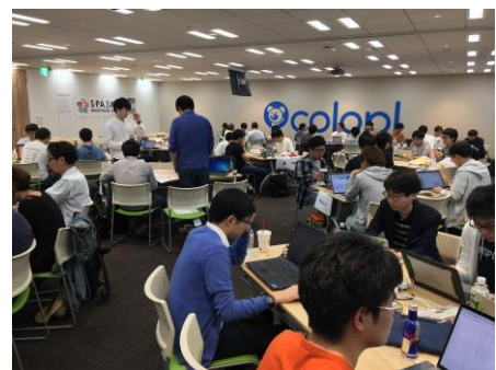
東京 B 予選開発風景