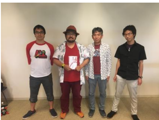
最優秀賞チーム「逆襲の餃子とビールと〇〇」