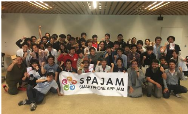
東海予選集合写真