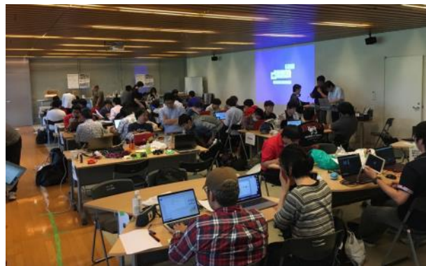
東海予選開発風景