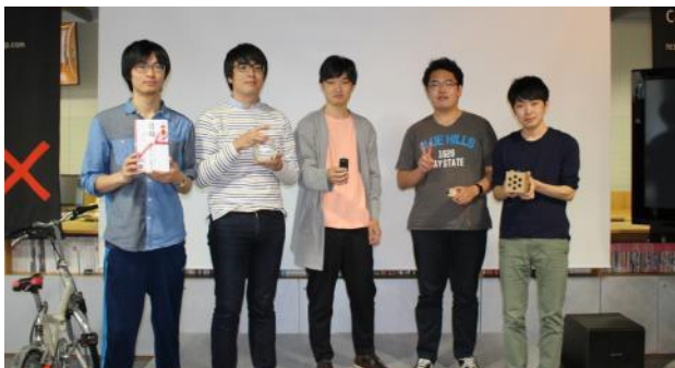
最優秀賞チーム「卍」

技術力、完成度の高さが評価され、最優秀賞を獲得。審査員からは「これなら金魚を飼ってみたい」という声もあり、新たな価値創出にも貢献していた。