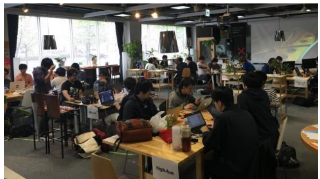
札幌予選開発風景