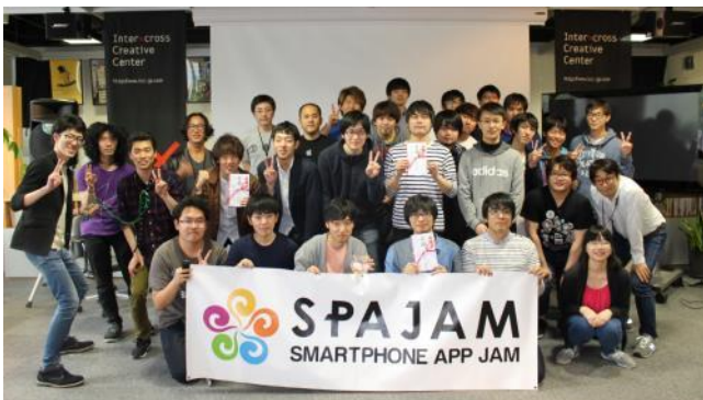
札幌予選集合写真