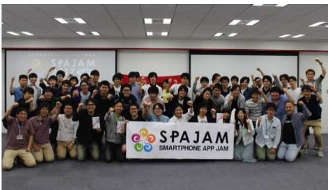
東京D予選集合写真