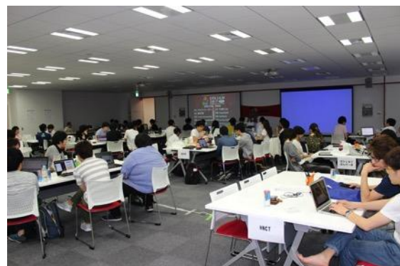
東京D予選プレゼン風景